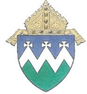
Diocese of Reno Bishop Randolph Calvo,

Nevada Catholic Conference 2805 Mountain Street Carson City Nevada 89703 (775) 222.0027 nvcatholicconference@gmail.com